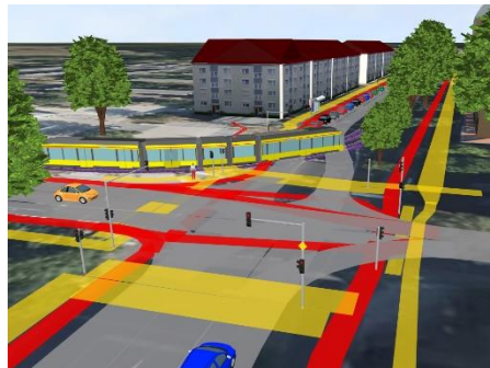
Verkehrssimulationen mit PTV Vissim