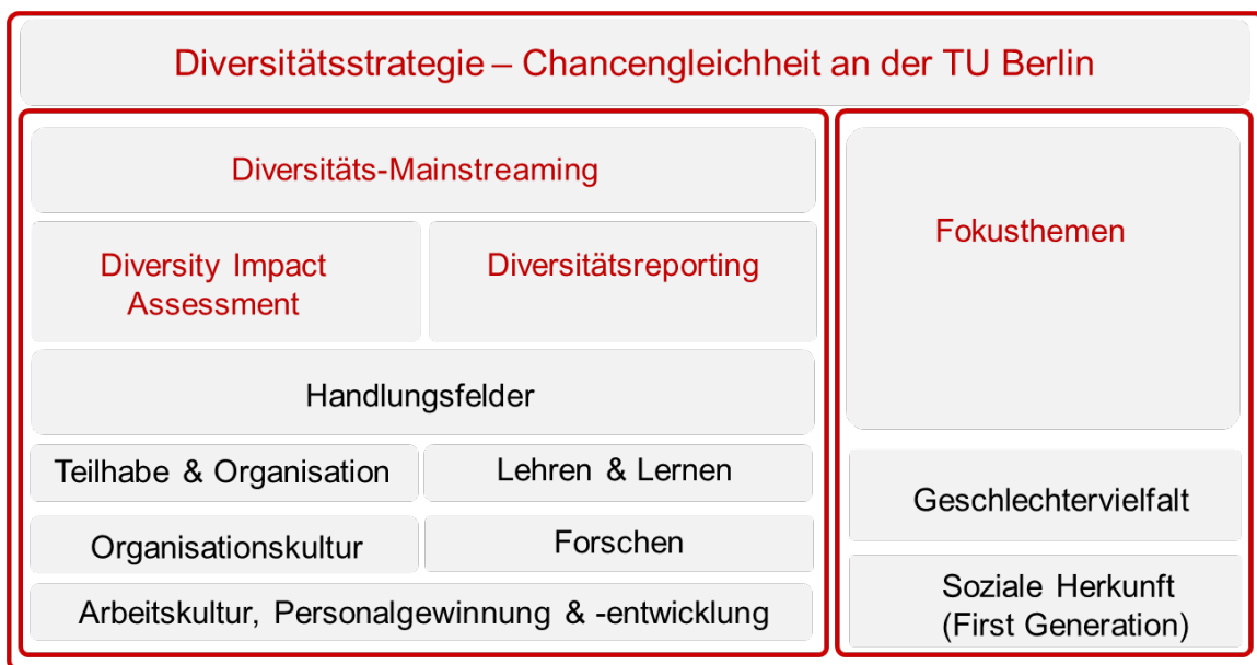
Abbildung 2: Umsetzung der Diversitätsstrategie an der TU Berlin.

Abbildung 2 stellt dar, wie im Sinne des Diversitäts-Mainstreamings Diversitätsaspekte systematisch und flächendeckend in den zentralen Handlungsfeldern der universitären Entwicklung integriert werden sollen. Komplementär dazu behandeln die Fokusthemen spezifische Fragestellungen für einen bestimmten Zeitraum schwerpunktmäßig. Diese Aktivitäten werden begleitet durch ein Diversitätsreporting, welches darauf zielt, Erkenntnisse über die Diversität der TU Berlin und ihrer Mitglieder zu gewinnen, bestehende Maßnahmen summativ zu evaluieren und die Effekte der durchgeführten Maßnahmen sichtbar zu machen.